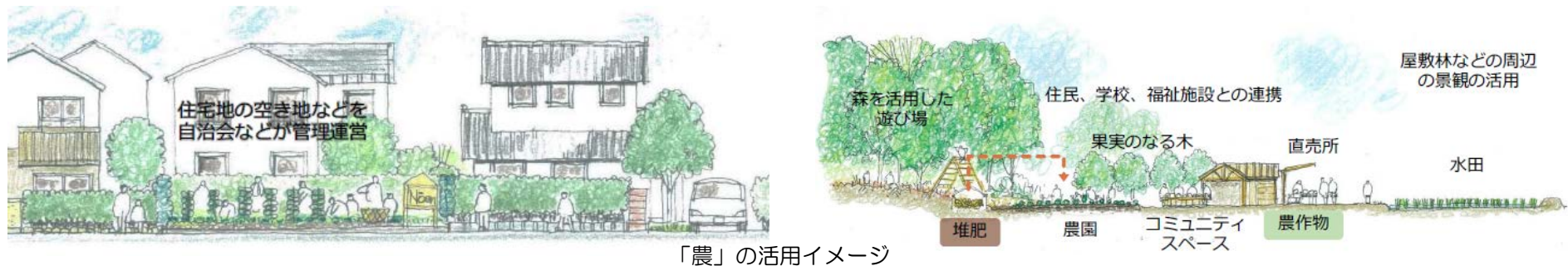
「農」の活用イメージ