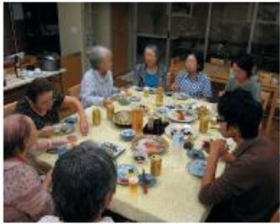
土間のある談話コーナーで収穫パーティ