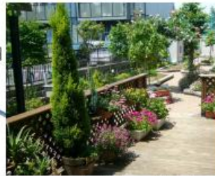
花のあふれるウッドテラス