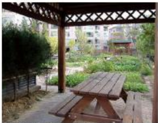
自然を感じ屋外生活を楽しむ四阿