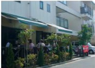
談話スペースとつながる半屋外のテントスペース