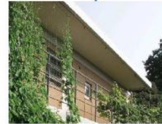
バルコニーで楽しむ緑のカーテン キッチン中心の住戸プラン