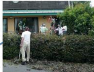
近隣とのコミュニケーション