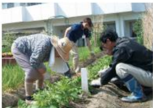
住まいに隣接した体験農園 地域の方も入園可能