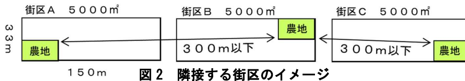
図2 隣接する街区のイメージ

一つの農地を 100 m 2 以上としたのは、都市計画運用指針において、100 m 2 程度を下限としているためです。農地等との直線距離を 300m 以下とした理由は、次のとおりです。都市計画運用指針が「隣接する街区に存在する複数の農地等」も一団とみなす、との考えを示す中で、本市では、短辺に画地が二つ収まるモデル的街区を想定しました（図 2 参照）。本市の住居表示整備実施基準においては、一街区の面積はおおむね 3,300~5,000 m 2 程度と定めていることから、モデル的街区は長辺 150m×短辺 33m の 5,000 m 2 としています。その場合、隣接する街区を含む距離は、長辺 150m を 2 倍した 300m より短くなることから、農地等との距離を直線で 300m 以下としました。また、同一の経営体により管理された農地に限ったのは、栽培管理状況の均一性が確保されていることから、一体とした緑地機能が発揮されていると考えられるためです。