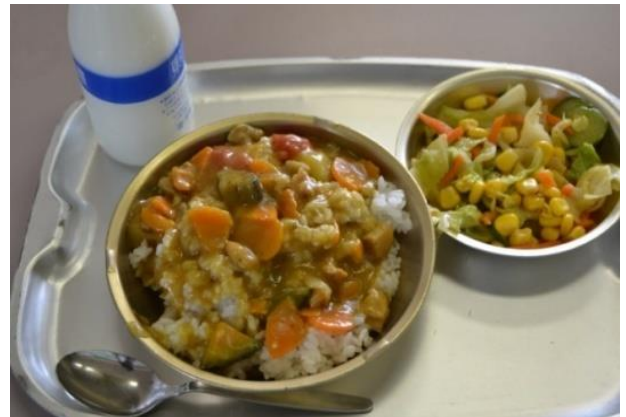
【小平夏野菜カレーの日】