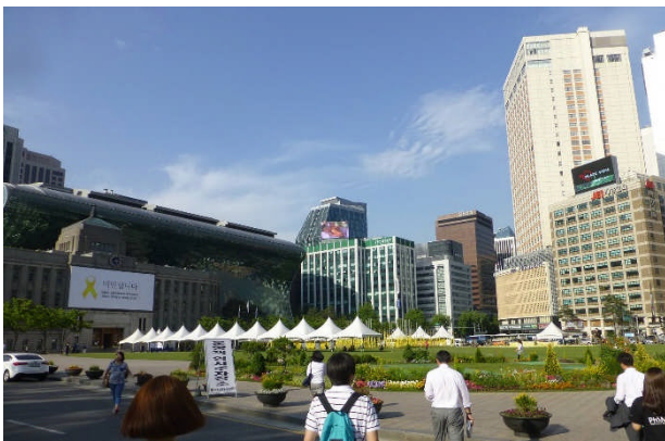
写真1. セウォル号事件の犠牲者追悼と不明者の帰還を祈る会場となったソウル市役所前広場

それに対して、我が国にとって最も近い海外「韓国」は歴史文化にも共通のルーツがあり、都市の成り立ちや気候風土にも似ているところがあるのに不思議と都市の世界ではあまり情報の交流がなかった。そのようななか、都市農業に関しては、ほぼ同時期に同テーマでの取り組みが法律レベルでなされたことには何かしらの「縁」を感じずにはいられない。本稿では、両国の都市農業に関する