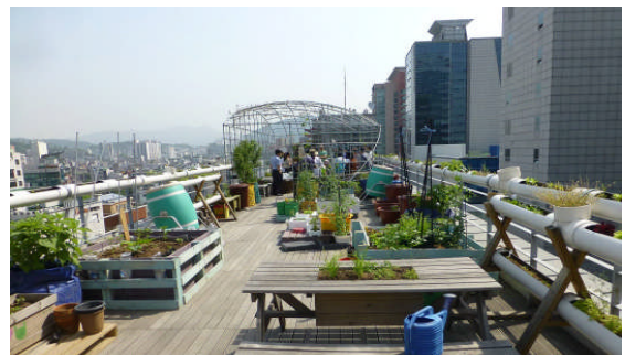
都心のビル屋上の農園(弘大地区のYMCAビル)