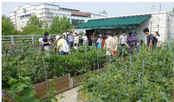
農産物直売所屋上の農園(ソウル市江東区)