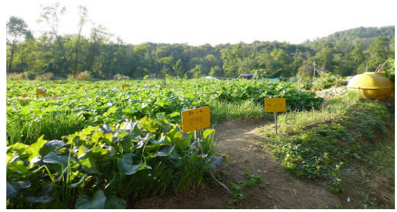
ソウル市郊外の有機農法市民農園(ソウル市江西区)