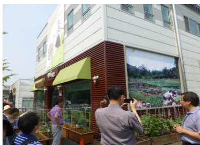
市街地内の農産物直売所 (ソウル市江東区)