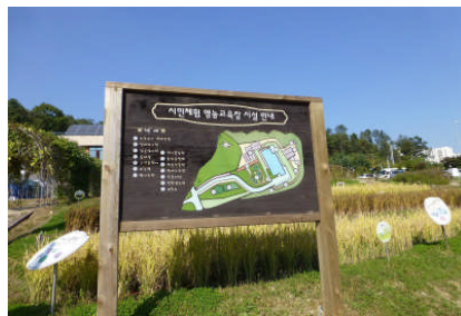
市民農業体験教育園 (ソウル市江東区)