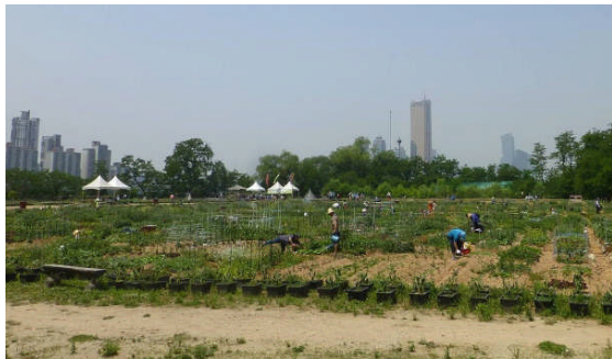
ソウル市ノル塔島の市民農園 (先に見えるのは汝矣島(ヨイド)にある最近まで韓国一の高さを誇った63ビル)

ところが、この隣国同士、このような制度や政策の仕組みなどについて情報交流をすることはこれまであまりなかったのではないだろうか。この背景には我が国が欧米ばかりを見てきた傾向があることは前述したが、よく見てみると我が国にとって本当に役立つ情報は、実は身近な隣国にあるのかもしれない。外交問題はいろいろ課題のある両国だが、都市農業問題についてはよりよい都市農業のため互いに交流、連携するところは多々あると思うのである。