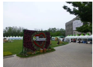
2015年は華やかに開催された都市農業博覧会 (ソウル市役所前広場)