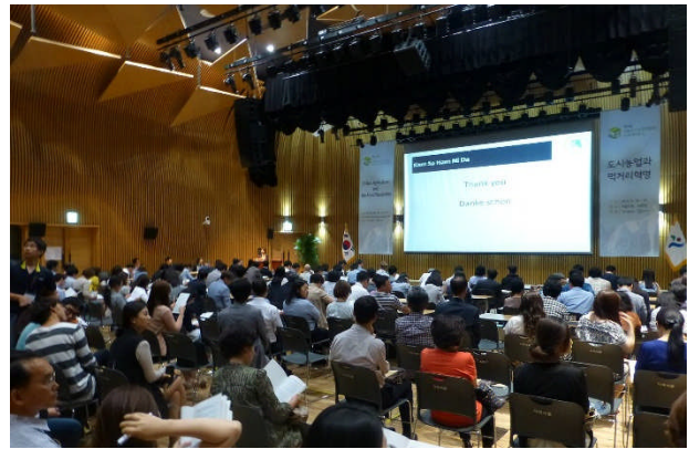
写真2. 研究発表会だけとなったUrban Agriculture Expo.の会場（ソウル市役所内ホール）