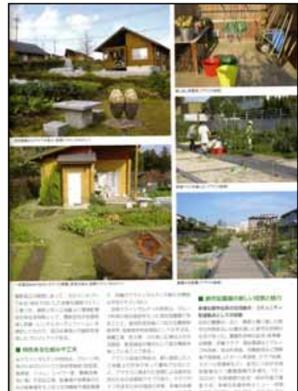
多様化する農園、菜園、クラインガルテン